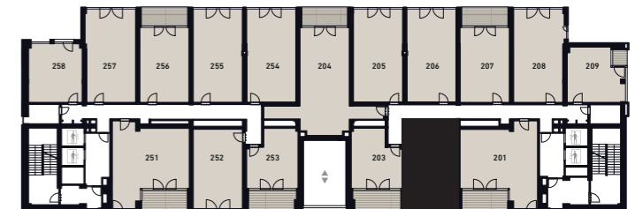
PATRO FLOOR 2-3