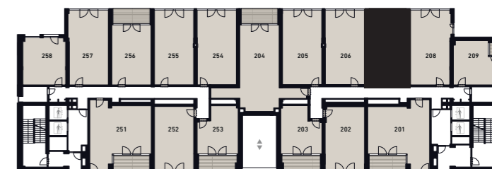
PATRO FLOOR 2-3